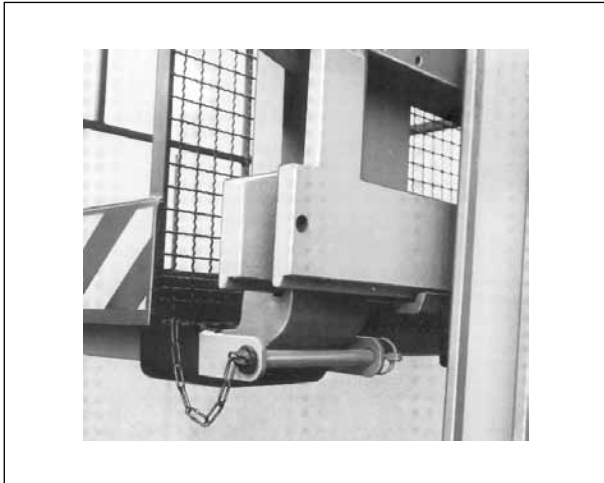
Figura 3. Dispositivo de bloqueo de los canales de la plataforma

dispositivos de anclaje para los arneses que puedan llevar los operarios. Los anclajes deben tener una resistencia suficiente de acuerdo con la norma UNE-EN 795 para ser utilizados como puntos de anclaje y estar señalizados indicando que no se pueden utilizar como equipos contra caídas de altura en caso de vuelco de la carretilla . Si la evaluación de riesgos determina que la carretilla puede volcar (situación que no debiera poder producirse ya que la carretilla debe estar parada y estabilizada), la seguridad del operario solo estará garantizada si éste está sujeto a otro punto de anclaje ajeno al equipo.